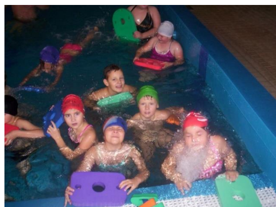
Z plaveckého kurzu našich žáků naší školy