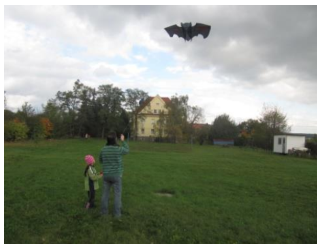
Foto z činnosti ŠD a ŠK