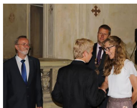
Slavnostní vyřazení žáků IX. A v chotěšovském klášteře