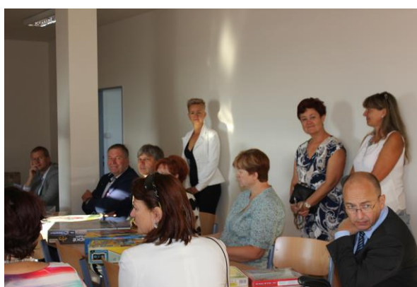
Ze slavnostního otevření učebny digitálních technologií a přírodních věd dne 18. 9. 2018