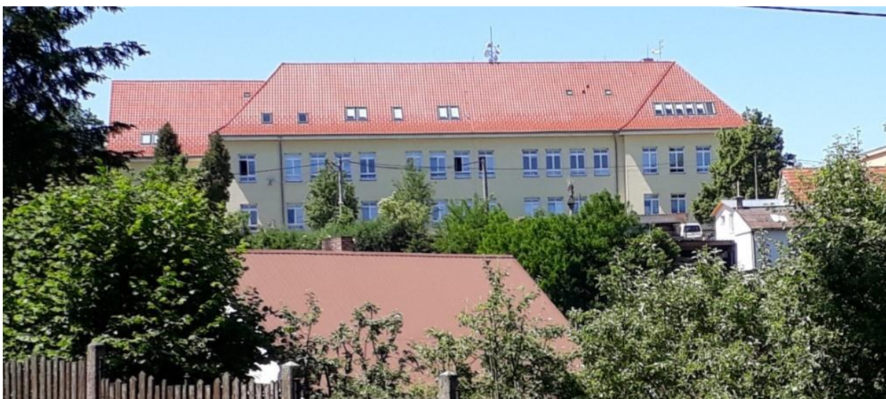
Letní fotografie budovy školy pořízená z Lesní ulice