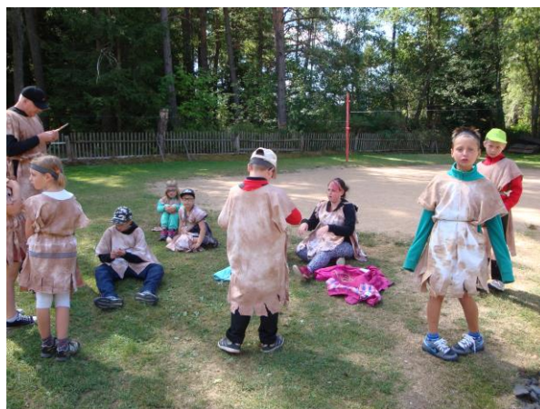
Z programu letního tábora v Kunkovicích na Klatovsku