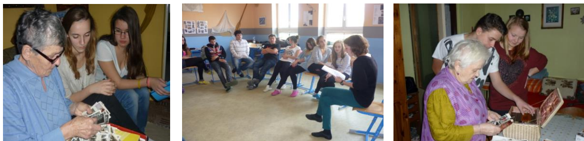
Z projektu Obrazy historie regionu

rozhovory s pamětníky. Některé příběhy byly dramaticky ztvárněny a prezentovány na společném divadelním dnu a setkání českých a německých škol. Součástí projektu byl i výlet po stopách zaniklých sudetských obcí.