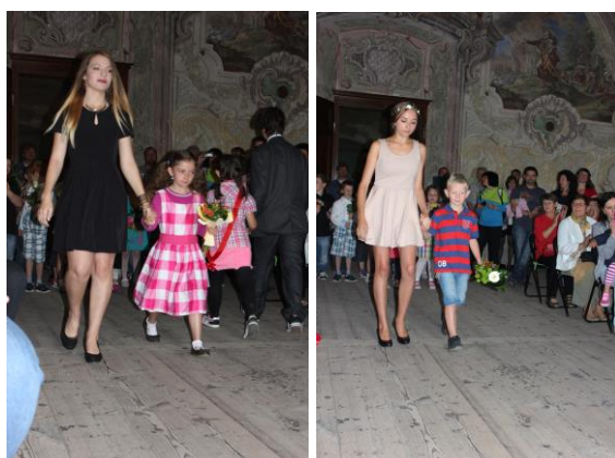
Slavnost pro prvňáčky – předání vysvědčení a šerpování- 30.6.2015 v klášteře