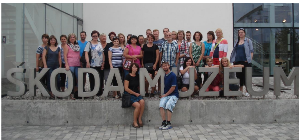
Tematický zájezd do Mladé Boleslavi do automobilových závodů Škoda auto dne 28.8.2015

Na základě organizační struktury školy je vytvořen Školní řád ZŠ Chotěšov a systém interních organizačních směrnic. Školní řád obsahuje základní pravidla fungování organizace a zásady pro hodnocení vzdělávacích výsledků žáků a jejich chování. Školní řád je zveřejněn na webu školy, je k dispozici v sekretariátu školy a všech sborovnách učitelů.