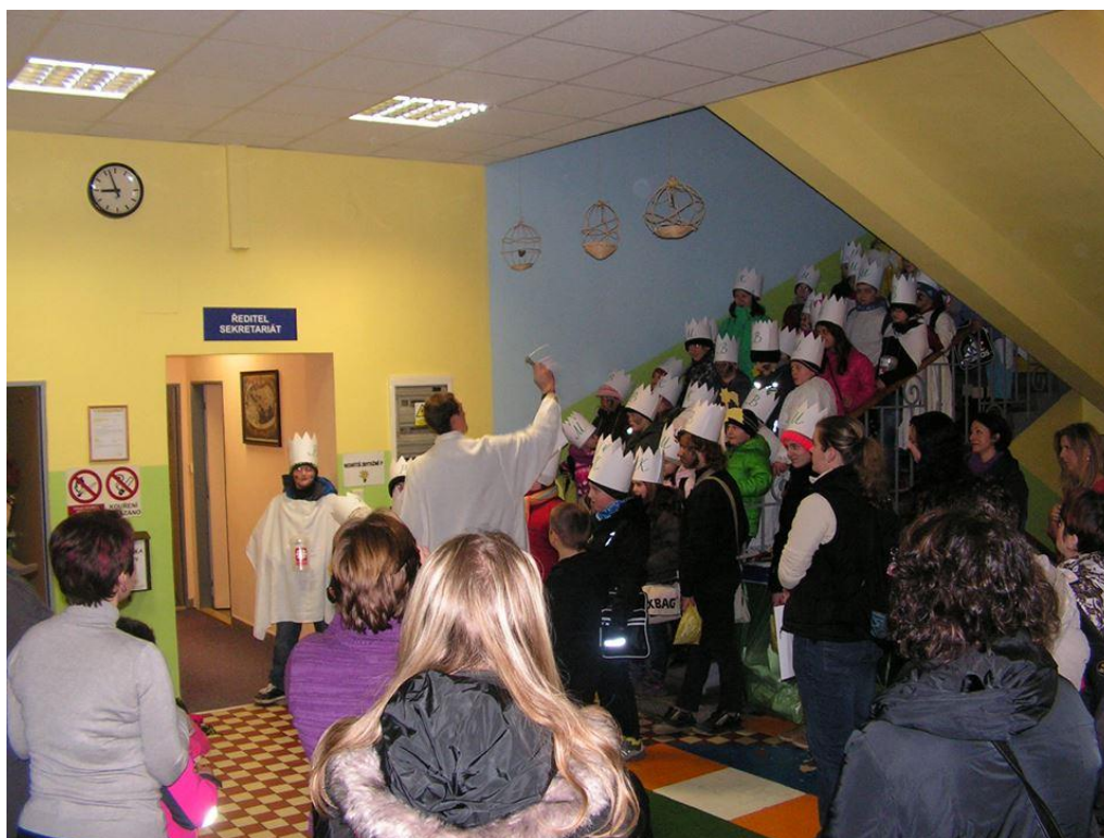
Na chodbě školy před obcházením Chotěšova a přilehlých obcí