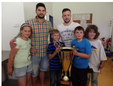
Z besedy s mistry v házené Talent Plzeň