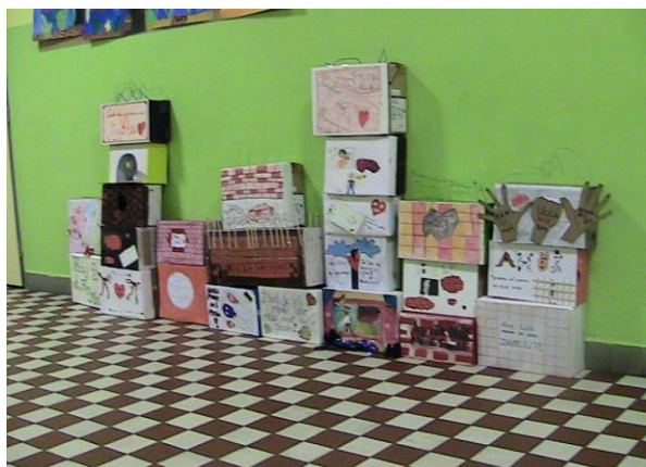
Z výtvarných aktivit žáků na základě výstavy Berlínská zeď