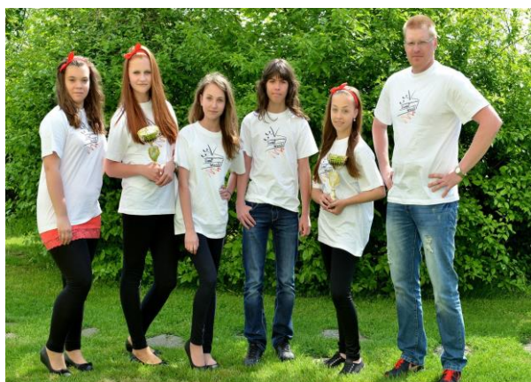
Účastníci minipodniku Sweetworld - projekt Praxin Obchodní akademie Most