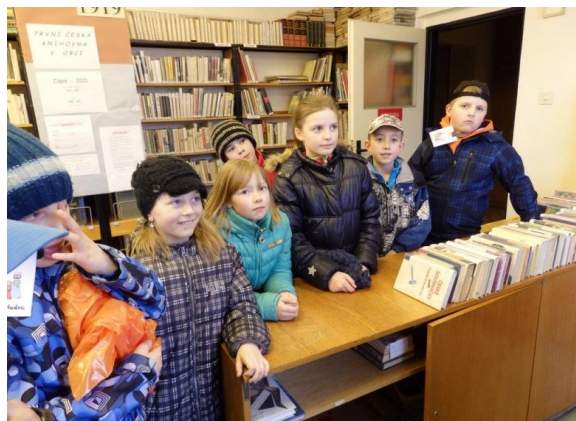
V knihovně V.Hataje