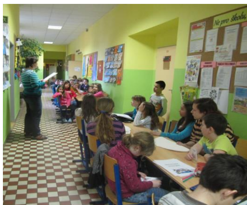
Předčítání ve škole