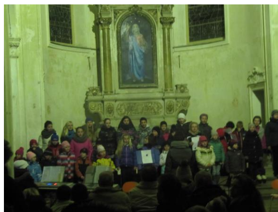
Adventní koncert v klášteře

Od července 2014 je škola zapojena jako partner v několika projektech: Učíme digitálně, Praxin a Obrazy historie regionu. Všechny projekty přinesly škole finanční prostředky, nové vybavení pedagogům i žákům a prožitky a zkušenosti především našim žákům.