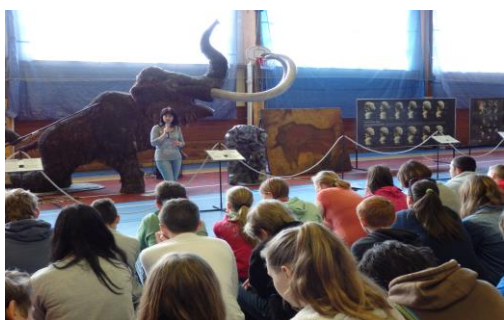
Den Země včetně přednášky Pravěk 22.4.2015