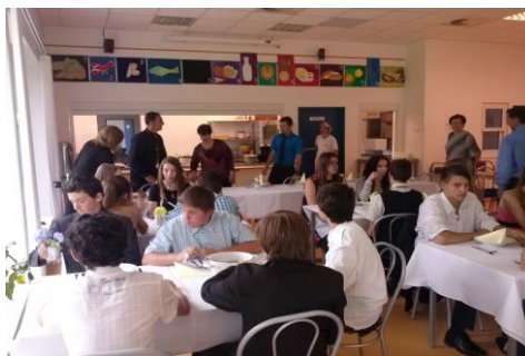
Slavnostní oběd při závěrečných zkouškách

Pro žáky 9. ročníku připravila škola závěrečné zkoušky. Uspěli všichni kromě jednoho. Žáci, kteří ukončili základní vzdělání v 9. ročníku, byli slavnostně vyřazeni pod freskou kláštera Chotěšov, kde kromě závěrečného vysvědčení obdrželi pamětní list, kovové propisovací kuličkové pero s nápisem „Absolvent ZŠ Chotěšov“ a další upomínkové předměty.