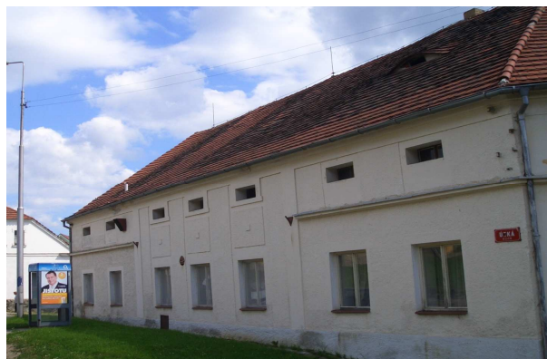
Školní jídelna (Dobřanská 3)