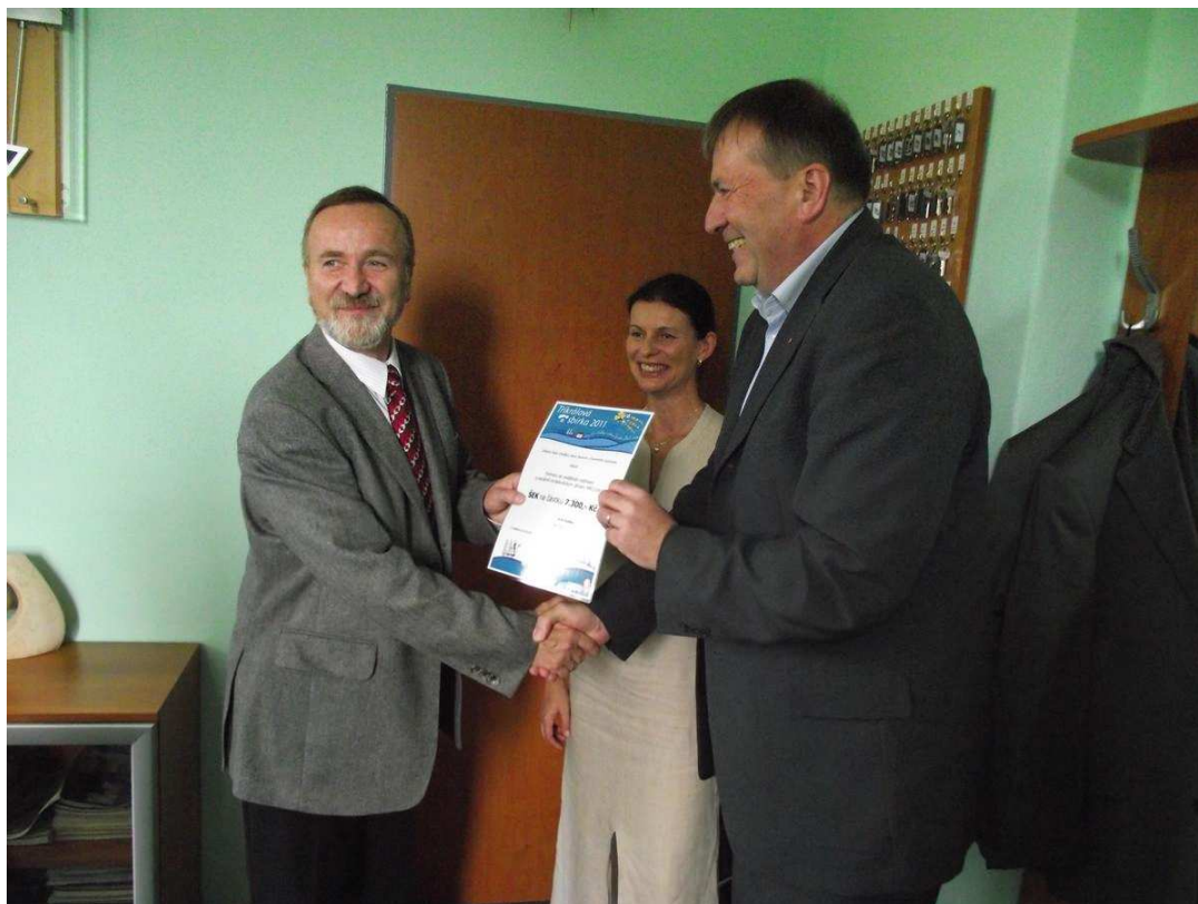
Předání částky 7.300,- Kč Domovu se zvláštním režimem a sociálně terapeutickým dílnám v Meclově