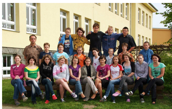
Školní rok 2009 - 2010