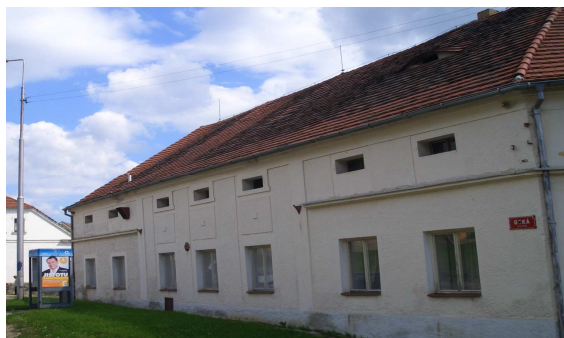
Školní jídelna Dobřanská 3