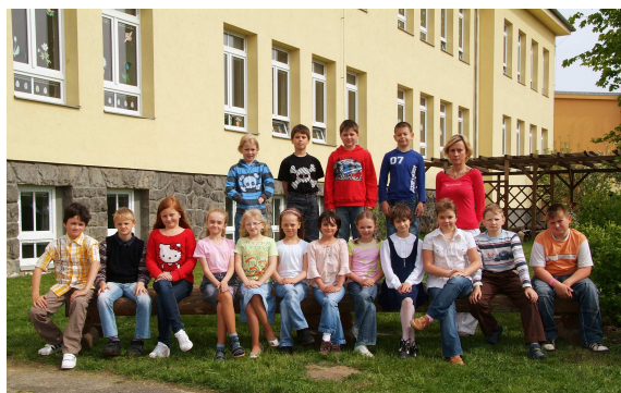
Školní rok 2009 - 2010