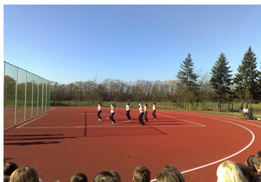
Hřiště slouží druhý rok