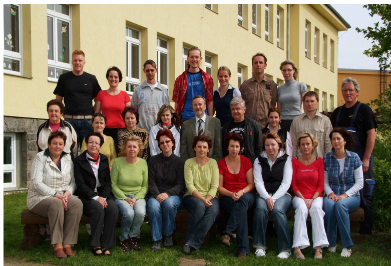
Školní rok 2009 - 2010