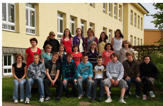
Školní rok 2009 - 2010