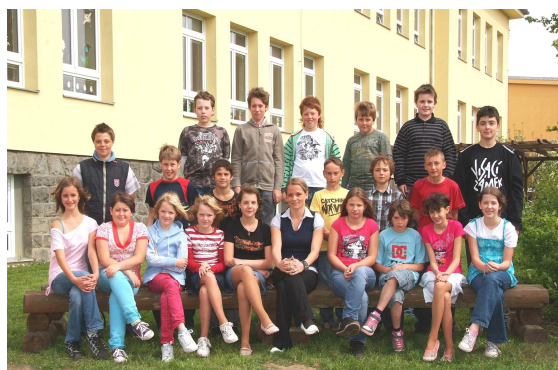
Školní rok 2009 - 2010