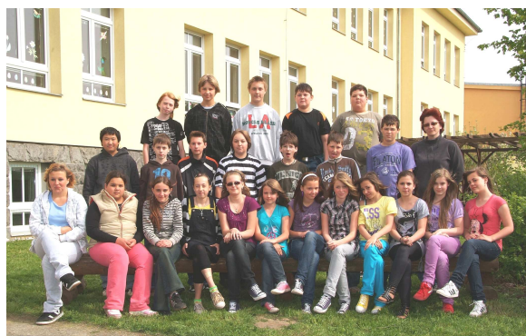
Školní rok 2009 - 2010