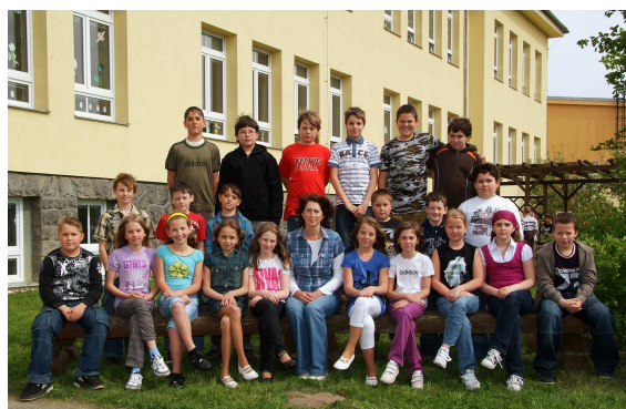
Školní rok 2009 - 2010