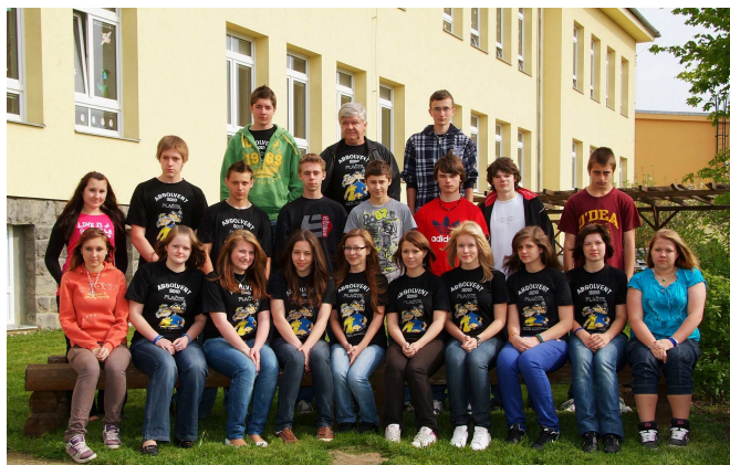
Školní rok 2009 - 2010