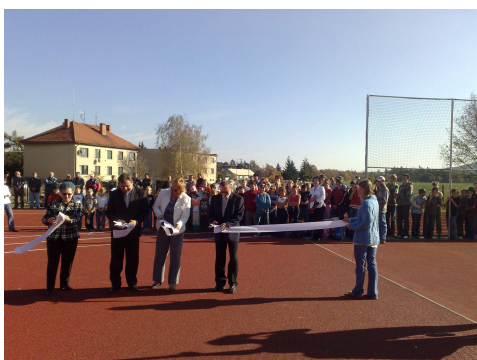
Slavnostní otevření hřiště 2008