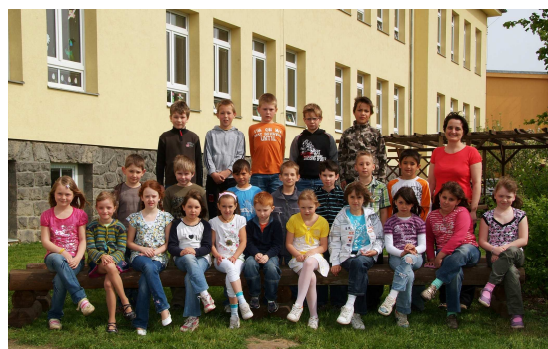
Školní rok 2009 - 2010