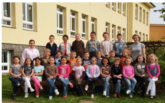
Školní rok 2009 - 2010