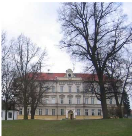
Budova školy v Plzeňské 88