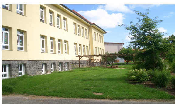
Školní zahrada u budovy Plzeňská 388