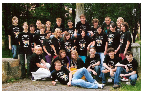
Školní rok 2008 - 2009 IX.A