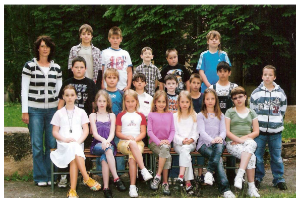
Školní rok 2008 - 2009