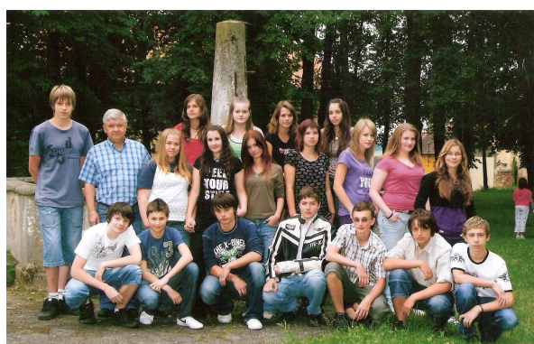
Školní rok 2008 - 2009 VIII.A