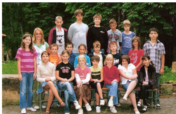
Školní rok 2008 - 2009