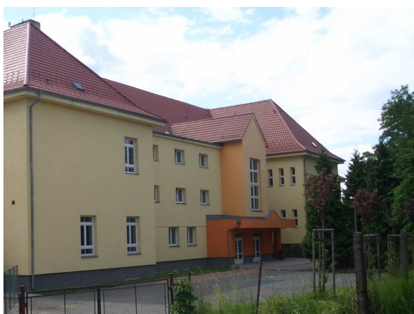
Budova škola v Plzeňské 388