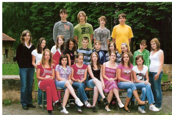
Školní rok 2008 - 2009 VII.A