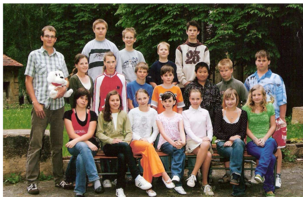
Školní rok 2008 - 2009 VI.A