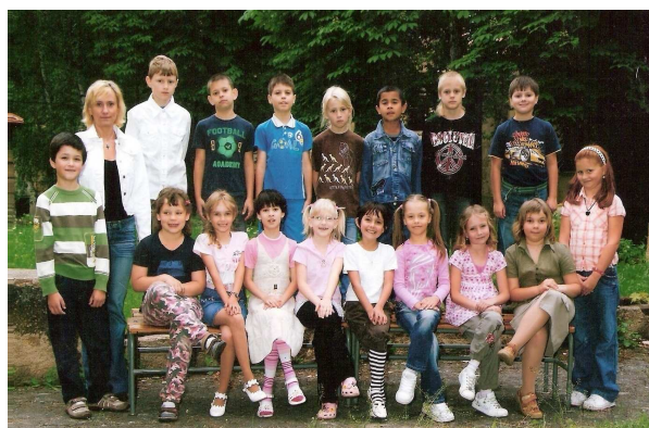
Školní rok 2008 - 2009