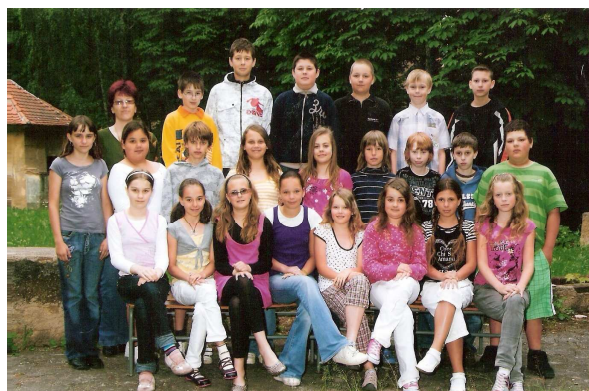
Školní rok 2008 - 2009