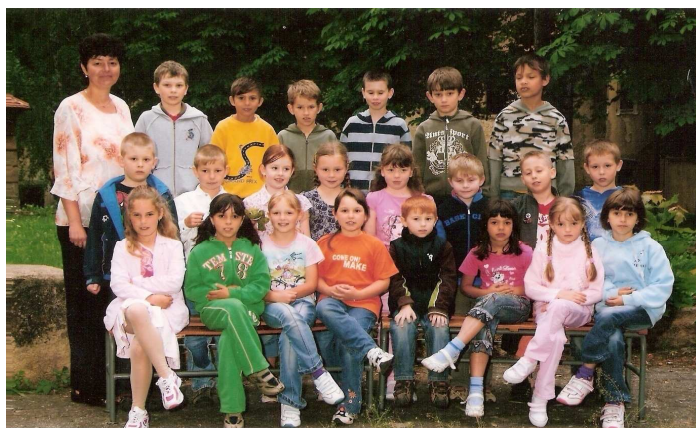
Školní rok 2008 - 2009