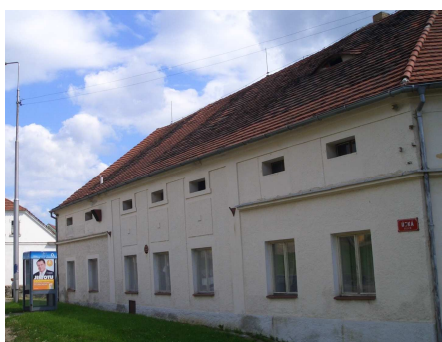
Školní jídelna v Dobřanské 3