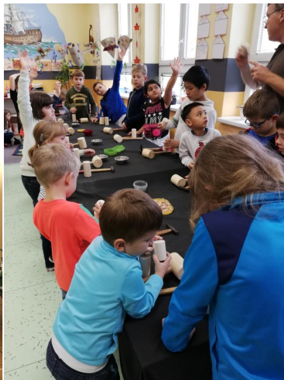
Výtvarné tvoření - halloweenská výzdoba do školní jídelny, výroba loutek