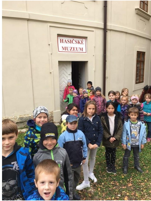
Návštěva kláštera a Hasičského muzea