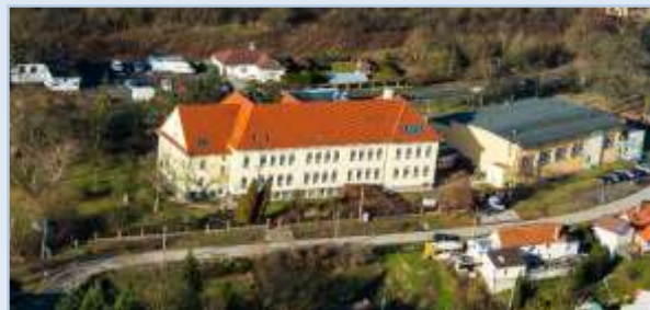
Letecký pohled na školu